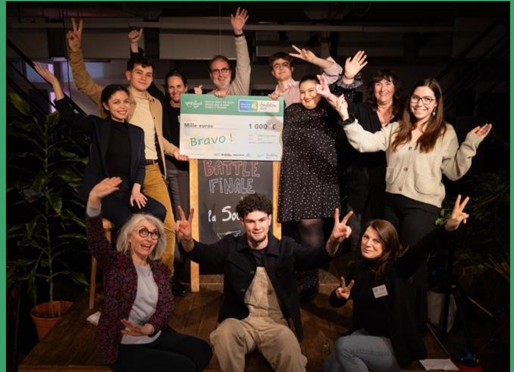
Prix Coup de Pouce Fondation GRDF, la Social cup 2025 Association makesense

Depuis 2020, la Fondation GRDF a versé, au titre du mécénat , 4,5 millions d'euros de subventions au profit de projets d'intérêt général.